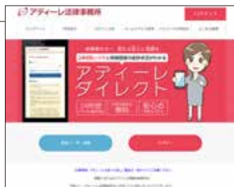
アディーレダイレクトのトップ画面