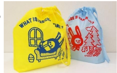
<ロフトオリジナル 2WAY エコバッグ>