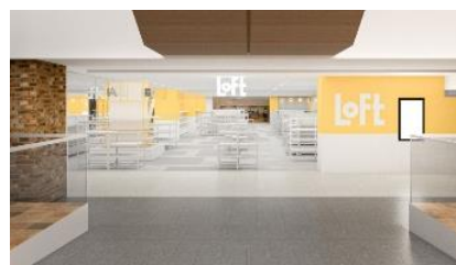
<新「あべのロフト」店舗イメージ>

営業面積は、約316.59坪(約1122.88㎡)、ロフトで展開する店舗の中で標準的かつ最も見やすい店舗規模で、買い回りしやすいワンフロアタイプの店舗形態です。最新のレイアウトで、品ぞろえは トータルでおよそ23,300種類 。美容・健康雑貨(7,000種類)、文具雑貨(12,000種類)、バラエティ雑貨(2,900種類)、生活雑貨(1,400種類)の4領域にて、市(旬)と蔵(定番)の商品で展開します。